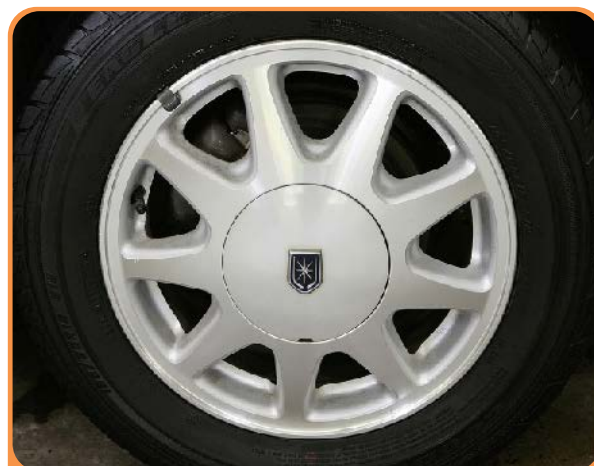
アルミホイールコート施工後