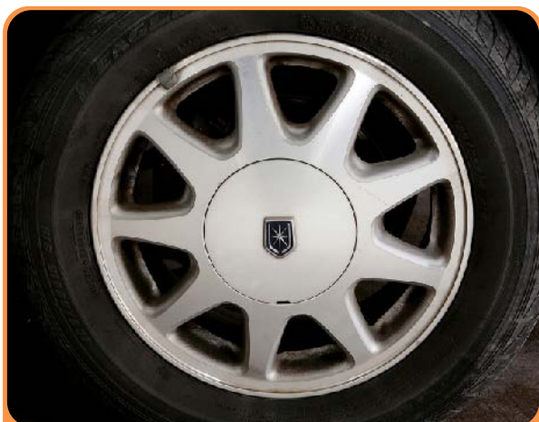
アルミホイールコート施工前