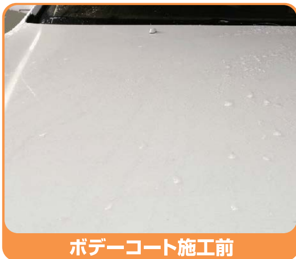
ボデーコート施工前

ボデー表面に付着した鉄粉を専用の鉄粉除去粘土で除去します。 水洗いした後、コンパウンドで頑固な水あかを取り除き、ボデー表面を磨き 上げます。最後にフッ素樹脂のコーティングをして塗装面の輝きを蘇らせます。