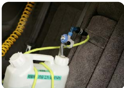
消臭剤噴霧機をリヤシートに設置

「消臭剤噴霧機」をリヤシートにセットします。エンジンを始動して、エアコンを最大風量で内気循環にし、作動させます。